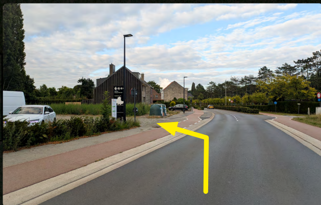
Sporthal Campus Wemmel